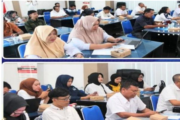
Gambar 4. Sosialisasi dengan Pelaku Usaha Thrifting Pada Tahun 2024