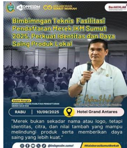
Gambar 6. Penyelenggaraan Sosialisasi Perkuat Identitas dan Daya Saing Produk Lokal Pada Tahun 2025

Meskipun pihak Dinas Perindustrian dan Perdagangan Provinsi Sumatera Utara telah merancang berbagai upaya seperti sosialisasi untuk membantu pedagang beradaptasi, namun kenyataannya belum seluruh pelaku usaha thrifting merasakan manfaat dari hal tersebut. Hal ini memperlihatkan bahwa strategi pemerintah dalam mendukung transisi ekonomi bagi pedagang belum terdistribusi secara merata dan masih kurang efektif dalam menyentuh kelompok sasaran secara langsung. Kondisi ini bertolak belakang dengan upaya formal Dinas yang menyatakan telah melakukan pendampingan dan sosialisasi, karena yang peneliti temui dilapangan, banyak pedagang yang merasa tidak mendapatkan solusi nyata terhadap larangan thrifting . Pernyataan tersebut dijelaskan lebih lanjut dalam wawancara yang dilakukan kepada beberapa para pelaku usaha thrifting :