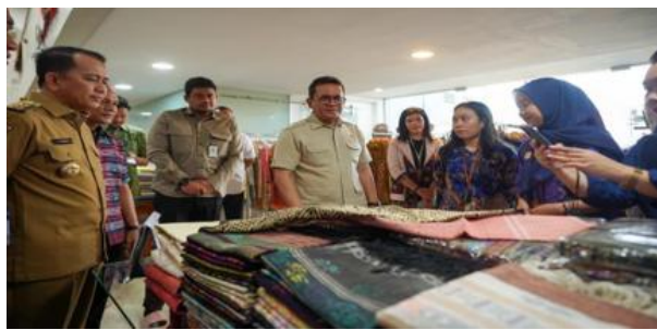
Gambar 5. Walikota Medan Bobby Nasution Tinjau Usaha Produk Tekstil Lokal Pada Tahun 2024

Berdasarkan hasil wawancara tersebut dapat disimpulkan bahwa strategi yang dijalankan oleh Dinas Perindustrian dan Perdagangan Provinsi Sumatera dalam mendukung industri tekstil lokal agar mampu bersaing dengan thrifting tidak hanya berfokus pada penindakan, tetapi juga melalui pendekatan pembinaan dan pemberdayaan pelaku usaha. Pendekatan ini dilakukan dengan memberikan pelatihan kepada pelaku UMKM tekstil dan konveksi untuk meningkatkan kualitas produk, serta memperluas akses pemasaran melalui partisipasi dalam bazar, dan jaringan distribusi pasar tradisional maupun modern. Langkah tersebut menunjukkan bahwa pemerintah daerah berupaya menciptakan ruang kompetitif bagi produk lokal, sehingga meskipun thrifting masih ramai diminati, pelaku UMKM tetap memiliki peluang yang kuat untuk berkembang dan memperluas jangkauan pasar.