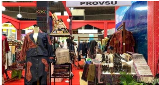
Gambar 1. Penyelenggaraan Bazar Produk Lokal Pada Tahun 2024

Berdasarkan hasil wawancara tersebut dapat dipahami bahwa kebijakan larangan thrifting ini tidak hanya dipandang sebagai langkah penegakan aturan, tetapi juga sebagai kebijakan yang harus diimbangi dengan strategi pemberdayaan. Dinas Perindustrian dan Perdagangan (Disperindag) Sumatera Utara menyadari bahwa penerapan larangan ini memiliki dampak langsung terhadap dua sisi. Di satu sisi, itu melindungi industri tekstil dan UMKM lokal, dan di sisi lainnya, memungkinkan pedagang kecil yang selama ini bergantung pada bisnis usaha thrifting untuk bertahan hidup. Upaya tersebut diwujudkan melalui kegiatan promosi produk tekstil lokal, penyelenggaraan bazar, kolaborasi dengan UMKM, serta komunikasi intensif dengan asosiasi pedagang untuk membangun pemahaman bersama terhadap tujuan kebijakan.