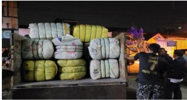
Gambar 3. Penyitaan Bal Impor Pakaian Bekas di Perumnas Simalingkar Pada Tahun 2023

Hal ini sejalan dengan ketentuan dalam Peraturan Menteri Perdagangan Republik Indonesia Nomor 40 Tahun 2022 tentang Barang Dilarang Ekspor dan Barang Dilarang Impor. Meskipun secara formal pemerintah telah menetapkan aturan dan melakukan berbagai upaya penertiban, tetapi para pelaku usaha thrifting justru merasakan ketidaksesuaian antara kebijakan dan pelaksanaannya. Hal ini didukung oleh penjelasan dengan beberapa pedagang usaha thrifting di Pamela terkait pemahaman mengenai kebijakan larangan thrifting :