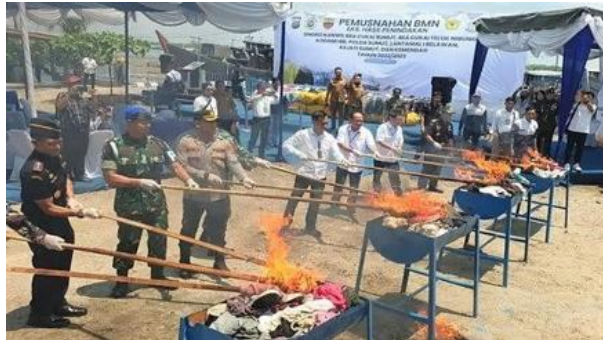
Gambar 2. Pemusnahan Barang Impor Pakaian Bekas Di Belawan Pada Tahun 2023

Dari hasil wawancara tersebut memperjelas bahwa Disperindag Sumatera Utara berfokus pada terhadap masuknya pakaian bekas impor ilegal. Strategi ini diwujudkan melalui razia dan pemantauan di pasar-pasar besar seperti Pajak Melati, Pajus, dan Pajak Sambu yang dikenal sebagai pusat thrifting di Medan. Langkah ini menunjukkan bahwa kebijakan larangan thrifting bukan hanya aturan di atas kertas, tapi benar-benar diterjemahkan dalam bentuk pengendalian langsung di lapangan. Selain razia, Disperindag Sumatera Utara juga melakukan koordinasi lintas instansi dengan Bea Cukai, Satpol PP, dan aparat kepolisian untuk memperkuat pengawasan di jalur distribusi, terutama di wilayah pelabuhan yang sering menjadi pintu masuk utama pakaian bekas impor.