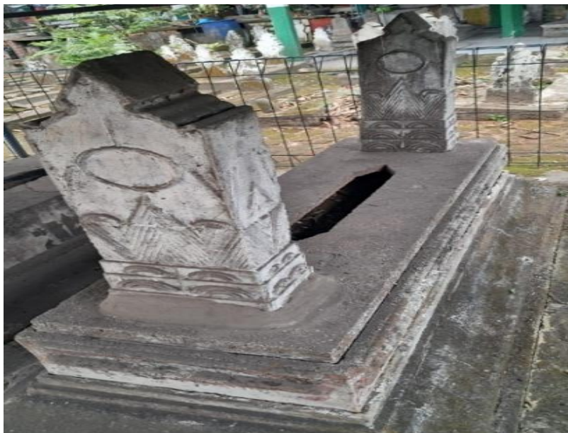
Gambar 1. Nilai Historis Motif Nisan pada Makam Al-Habib Ibrahim bin Zein bin Yahya

Ragam hias pada nisan juga sering menampilkan motif tumbuhan seperti sulur-suluran atau bentuk pucuk rebung. Dalam seni Islam di Nusantara, motif tumbuhan memiliki makna yang berkaitan dengan kehidupan, kesuburan, serta pertumbuhan. Dalam konteks makam, motif ini sering dimaknai sebagai lambang harapan akan adanya kehidupan baru setelah kematian. Beberapa penelitian mengenai ragam hias makam juga menyebutkan bahwa motif tumbuhan sering dihubungkan dengan gambaran taman surga dalam ajaran Islam yang melambangkan kedamaian serta kehidupan yang abadi di alam akhirat. Oleh karena itu, penggunaan motif tumbuhan pada nisan tidak hanya berfungsi sebagai elemen dekoratif, tetapi juga mengandung makna spiritual yang mencerminkan doa serta harapan bagi orang yang dimakamkan (Rahman et al., 2019).