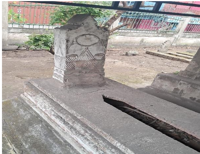
Gambar 2. Nilai Historis Motif Nisan pada Makam Al-Habib Ibrahim bin Zein bin Yahya

Pencipta. Dengan demikian, keberadaan motif lingkaran pada nisan dapat dimaknai sebagai pengingat akan keterbatasan kehidupan manusia sekaligus sebagai simbol kehidupan yang bersifat abadi setelah kematian (Lita and Bulukumba 2017).