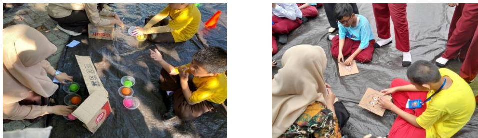
Gambar 1. Kegiatan Bina Diri

Selain itu, pendekatan yang mengaitkan kegiatan belajar dengan kehidupan sehari-hari juga diterapkan, misalnya dengan mengajak siswa berlatih membeli jajanan di kantin, menjaga kebersihan kelas, atau bermain peran untuk menanamkan nilai-nilai sosial yang melibatkan kerjasama antara guru kelas dan GPK. Cara ini membantu siswa memahami pelajaran sekaligus menumbuhkan keterampilan hidup yang penting untuk kemandiriannya.