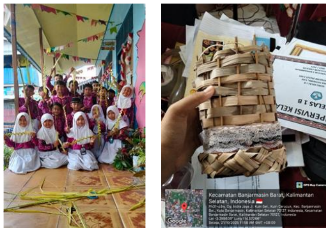
Gambar 1. Hasil Karya Siswa

Hasil implementasi program dari kegiatan ekstrakurikuler menganyam di SDN Kuin Cerucuk 4 yang dilaksanakan dalam seminggu sekali menunjukkan adanya peningkatan nyata pada keterampilan motorik halus, kemandirian, kreativitas, rasa percaya diri, disiplin, tanggung jawab, serta pemahaman siswa terhadap nilai budaya banjar. Dengan demikian implementasi dari program tersebut sangat baik diterapkan di sekolah karena tidak hanya meningkatkan keterampilan siswa, namun juga sebagai jembatan dalam mengenal budaya lokal di daerah mereka.